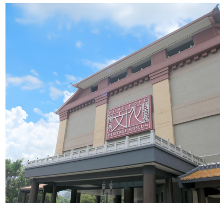
位於沙田的香港文化博物館「何去何從」？ 這個問題備受各界關注。

依據國際博物館協會（International Council of Museums, ICOM）的定義，博物館是指以「永久設立」為目的，以服務社會及其自身發展為方向，以獲取、保存、研究、詮釋與展示人類的有形和無形文化遺產及環境，它向公眾開放，以達成博物館教育、學習與娛樂等目標的機構。 1 參考其他的資料，博物館還能「使人們探索其藏品，以追求靈感、學習與享受。這些機構蒐藏、維護文物和標本，並使它們能讓公眾所運用，因此博物館受社會的付託，保存這些物件。」 2 而本港康樂及文化事務署轄下的主要博物館，均是國際博物館協會的成員，而該會將每年的5月18日定為國際博物館日，2023年的主題正是「博物館、永續性與健康福祉（Museums, Sustainability and